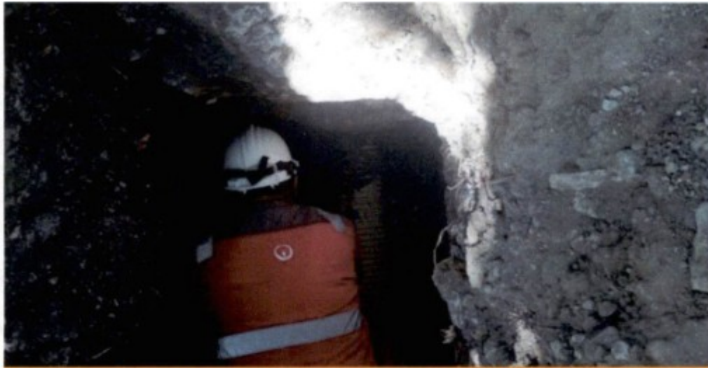
Avance de actividades - Conexión antigua red a nueva red