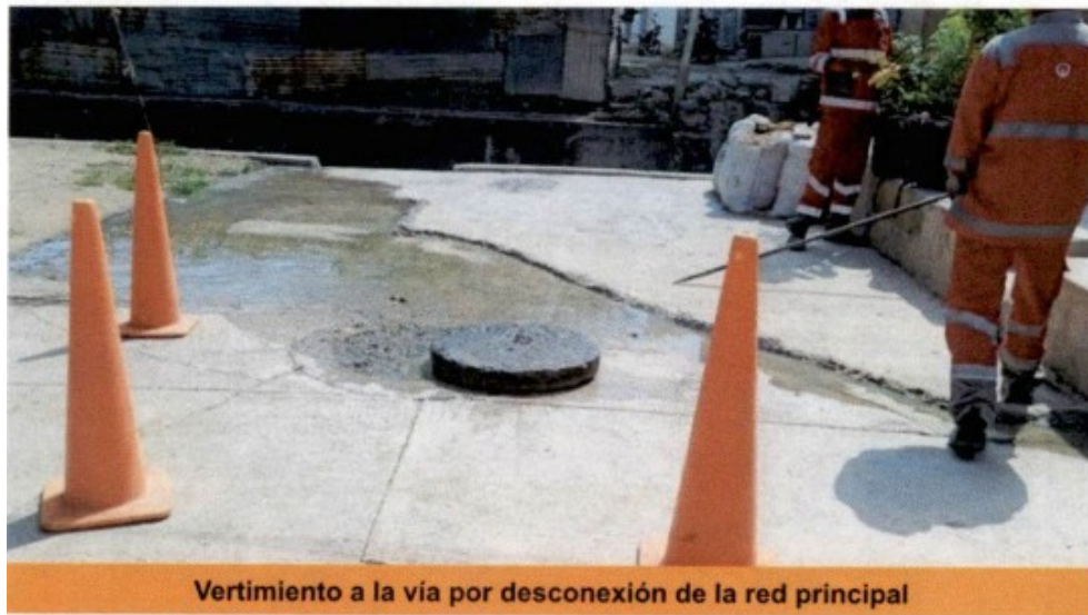
Vertimiento a la vía por desconexión de la red principal

Durante el recorrido realizado, se evidenció la presencia de un pozo de inspección rebosado vertiendo directamente a la vía y al arroyo canalizado del sector. Se procedió con el sondeo de la red principal, logrando identificar que éste tramo de tubería no fue conectado al nuevo colector instalado por el municipio de Sincelejo en las obras correspondientes al colector Villa Suiza. EN este sentido, esta tubería quedó aún conectada a la red que ya fue deshabilitada, generando el vertimiento que reportó la comunidad y que se aprecia en el siguiente registró fotográfico: