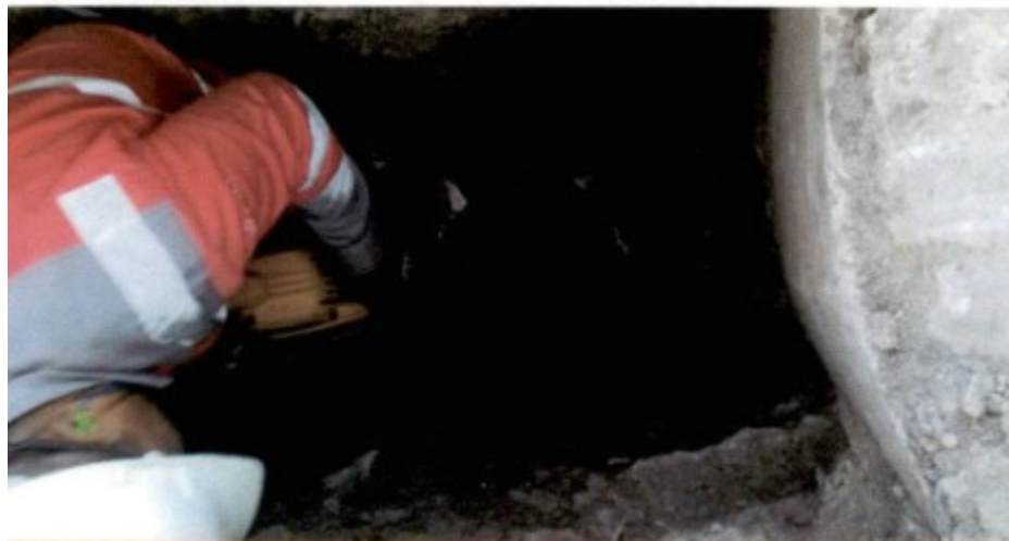
Avance de actividades - Perforación de Mh Existente para conexión