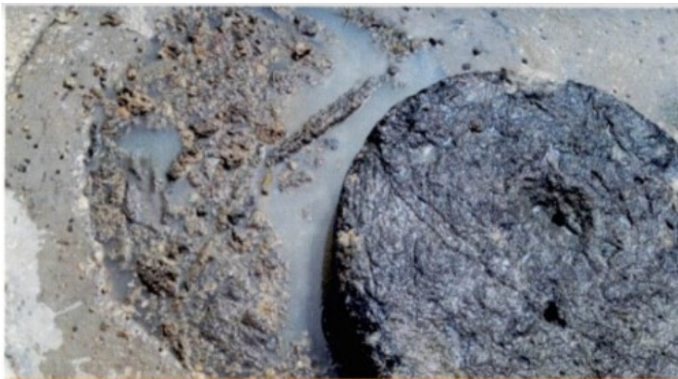
Vertimiento a la vía por desconexión de la red principal