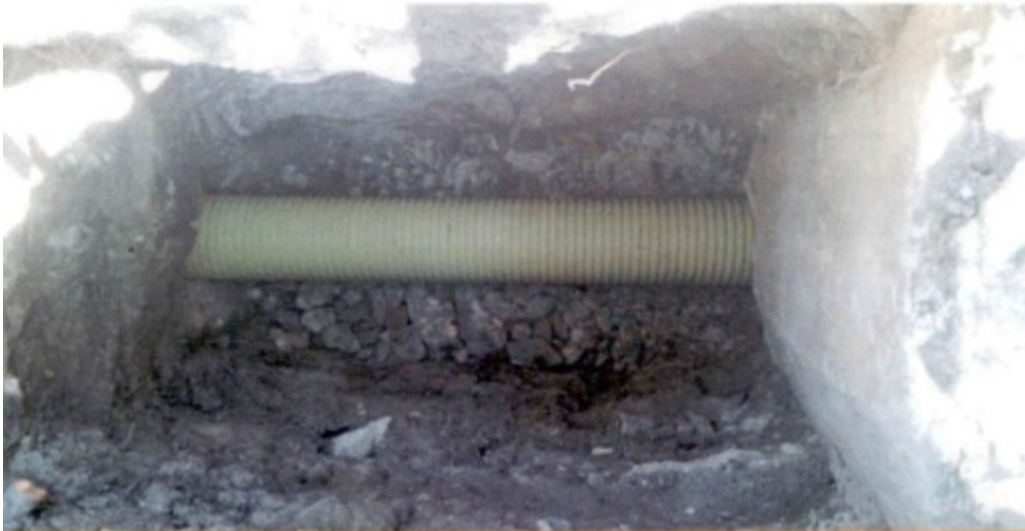
Avance de actividades - Conexión antigua red a nueva red