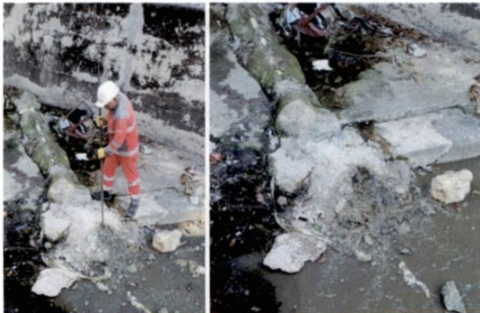
Vertimiento al arroyo - Red sin conexión al nuevo colector