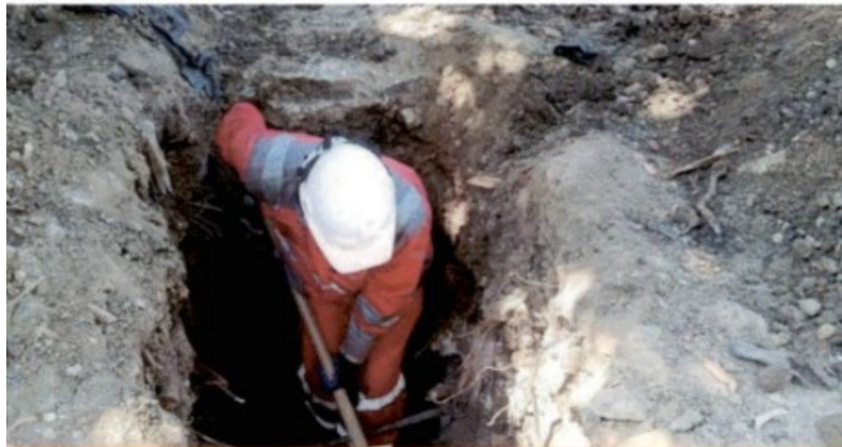
Avance de actividades - Excavación para Conexión a nueva red

De manera inmediata VEOLIA con su personal operativo de alcantarillado, procedió con las actividades necesarias para dar solución a la problemática identificada, las cuales consistieron en realizar la conexión de la red inconclusa identificada con la nueva tubería instalada por el municipio. Se adjunta registro fotográfico de las actividades realizadas: