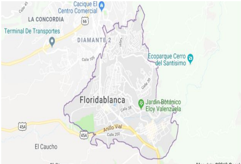
Mapa: Area Prestación servicio Municipio Floridablanca

Cláusula 8. PUBLICIDAD. El prestador del servicio publicará de forma sistemática y permanente, en su página web, en los centros de atención al usuario y en las oficinas de peticiones, quejas y recursos, la siguiente información para conocimiento del suscriptor y/o usuario: