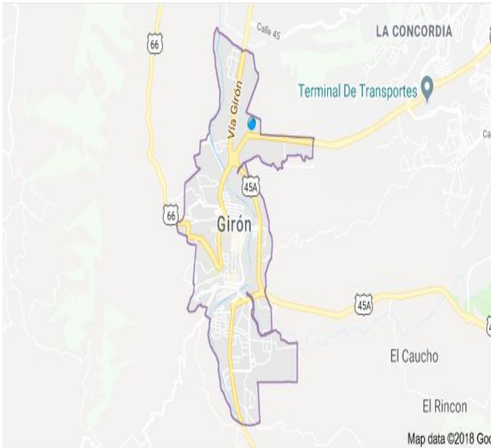
Mapa: Area Prestación servicio Municipio Girón

Cláusula 8. PUBLICIDAD. El prestador del servicio publicará de forma sistemática y permanente, en su página web, en los centros de atención al usuario y en las oficinas de peticiones, quejas y recursos, la siguiente información para conocimiento del suscriptor y/o usuario: