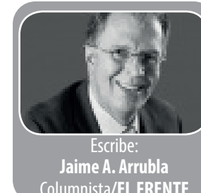
Escribió: Jaime A. Arrubla Columnista/EL FRENTE

Con ocasión de la acción de tutela que interpuso un médico de Cali para recibir con prioridad la vacuna contra el covid-19, invocando el dere-