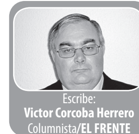
Escribió: Víctor Corcoba Herrero Columnista/EL FRENTE

El territorio de la manipulación y de la falsedad rueda por doquier. Viene haciéndolo como una bola de nieve. Lo cruel es que cada día es un poco más grande, lo que enviene las relaciones humanas y nuestra propia convivencia. Por ello, quizás tengamos que ahondar más en nosotros mismos, buscar tiempo para reflexionar sobre los mecanismos ocultos de la maldad, adentrarnos en sus raíces para poder cambiar el mundo gradualmente.