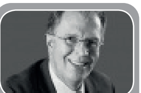
Escribe: Jaime A. Arrubla Columnista/EL FRENTE

Con ocasión de la acción de tutela que interpuso un médico de Cali para recibir con prioridad la vacuna contra el covid-19, invocando el dere-