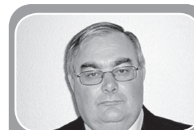
Escribe: Víctor Corcoba Herrero Columnista/EL FRENTE

El territorio de la manipulación y de la falsedad rueda por doquier. Viene haciéndolo como una bola de nieve. Lo cruel es que cada día es un poco más grande, lo que enviene las relaciones humanas y nuestra propia convivencia. Por ello, quizás tengamos que ahondar más en nosotros mismos, buscar tiempo para reflexionar sobre los mecanismos ocultos de la maldad, adentrarnos en sus raíces para poder cambiar el mundo gradualmente.