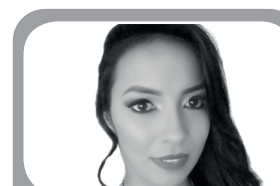
Escribe: Lizeth Navarro Contreras Columnista/EL FRENTE

Fue el 6 de marzo de 2020 cuando de manera oficial se reportó la primera persona contagiada por Covid-19 en Colombia, días después, exactamente el 21 de marzo de 2020 el Ministerio de Salud y Protección Social, confirmaba el primer fallecimiento a causa del virus, a partir de entonces la vida de millones de colombianos empezó a cambiar drásticamente, puesto que, el temor de contagiarse hizo que miles de personas empezaran a protegerse usando tapabocas, lavándose constantemente las manos, incluso empezó a escasear el gel antibacterial en muchas regiones del país y los precios de estos elementos se encarecieron tanto, que parecía que estuviéramos viviendo una película de terror.