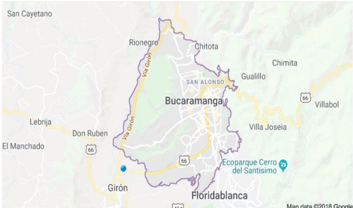
Mapa: Area Prestación servicio Municipio Bucaramanga

Ciáusula 8. PUBLICIDAD. El prestador del servicio publicará de forma sistemática y permanente, en su página web, en los centros de atención al usuario y en las oficinas de peticiones, quejas y recursos, la siguiente información para conocimiento del suscriptor y/o usuario: