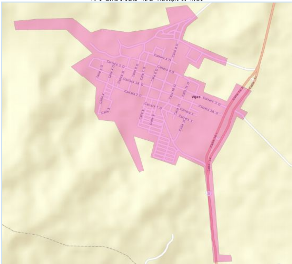
APS- Zona Urbana- Rural- Municipio de VIJES